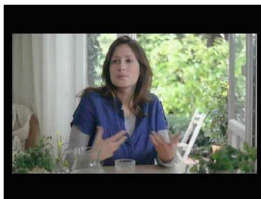
(1) ... changer le monde !