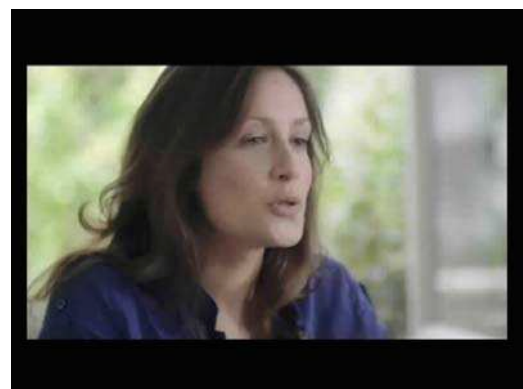
(1) ... Je suis pas idiote, je sais que je ne vais pas ...