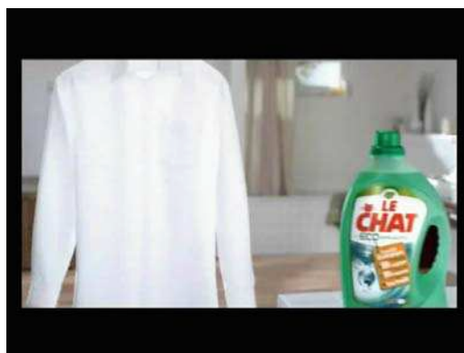
Voix homme (2) : " LE CHAT ECO EFFICACITE ...