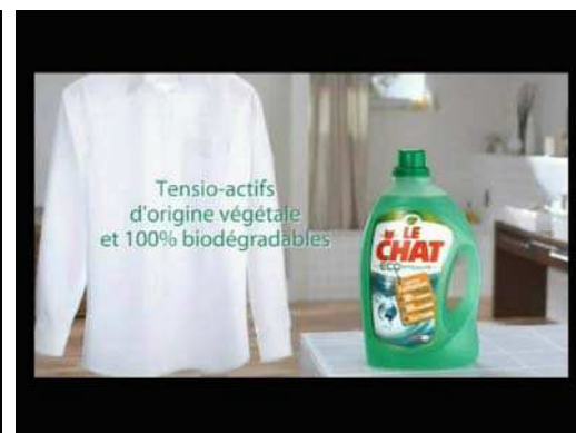
(2) ... aux tensio-actifs d'origine végétale et 100% biodégradable.