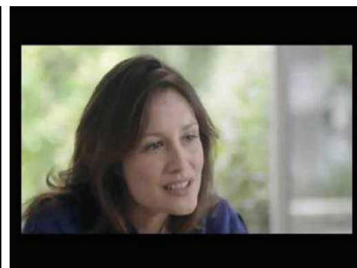
(1) ... Mais si on s'y met tous, ...