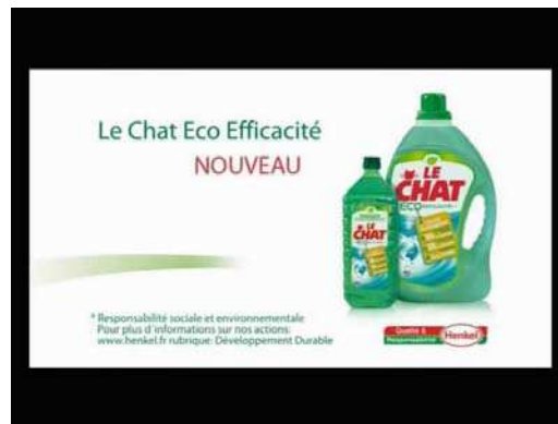
(2) ... LE CHAT ECO EFFICACITE ...