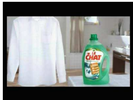
(2) ... Efficace même en eau froide.