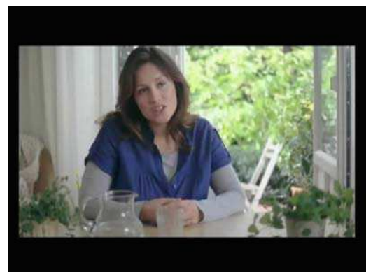
(1) ... on peut faire bouger les choses ! "