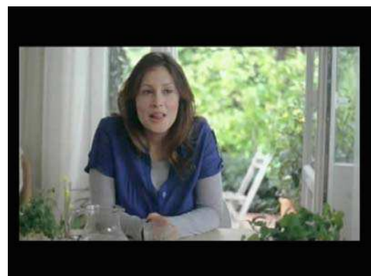
La femme (1) : " Pour moi l'environnement ...