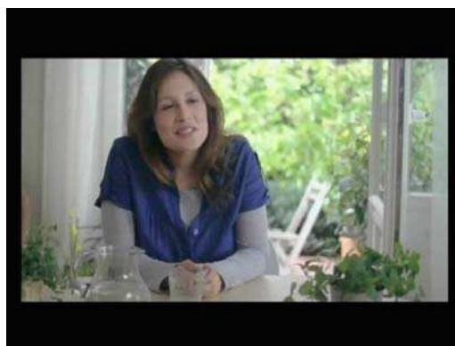
(1) ... c'est important !