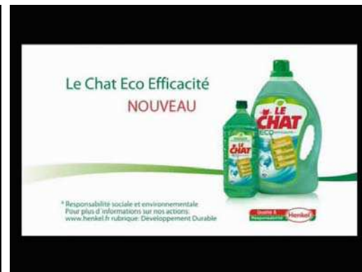
(2) ... on ne change pas le monde avec une lessive, mais on peut y contribuer ! "