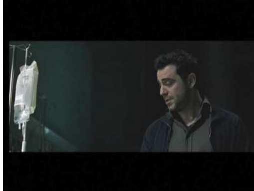
(1) ... Ou alors, on peut trouver quelqu'un pour te ramener.