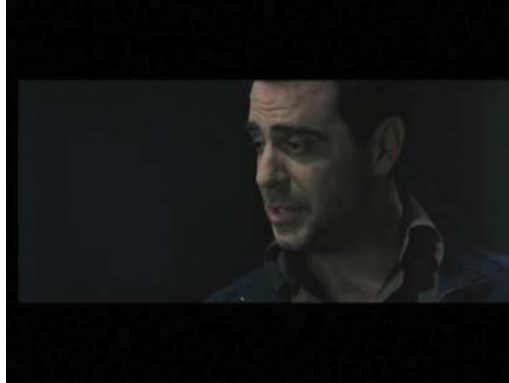
L'homme (1) : " T'es sûr que c'est une bonne idée de partir maintenant.