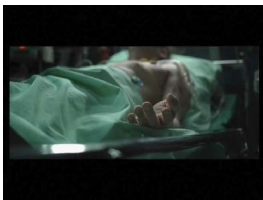
(1) ... Je sais que tu t'en sens capable ...