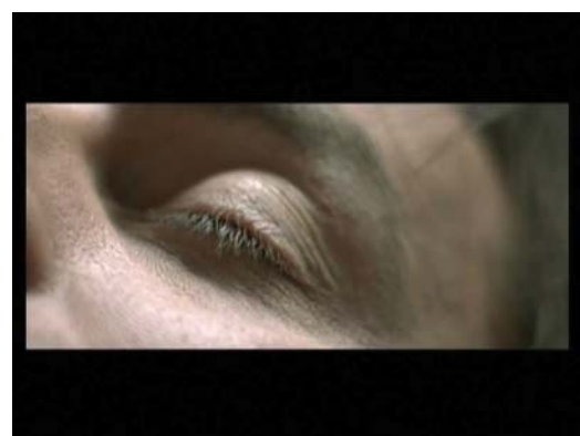
(1) ... mais t'es pas en état de conduire.