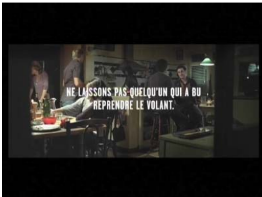
Voix femme (3) : " Quelques mots peuvent suffir à sauver une vie