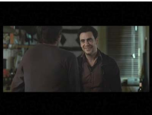
(1) ... Ben voilà. "

pays FRANCE agence production réalisateur titre LE RESCAPE version P