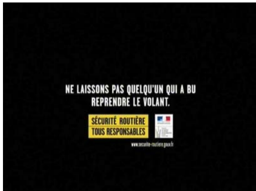
(3) ... Ne laissons pas quelqu'un qui a bu reprendre le volant. "