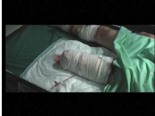
(1) ... On a un peu bu, ça serait idiot de prendre le risque.