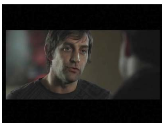
L'homme (2) : " Ouais, t'as raison, j'veais dormir ici. "